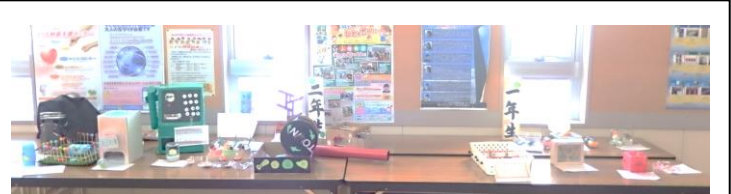
子ども達の頑張った作品を、是非、ご覧下さい

友達と教えあったり、グングンの先生に聞いたりと取り組んでいました。忘れかけていたことを学び直すことで、しっかりと覚えることができましたようです。